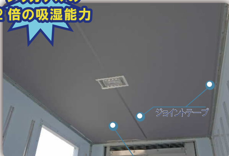
ジョイントテープ